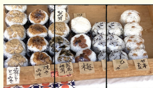
おにぎりや農園さん