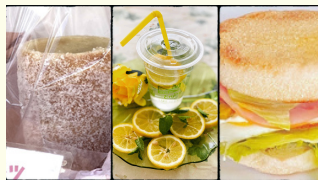
アンジェラズキッチンさん