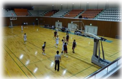
クラブ交流大会 (高知県バスケットボール協会)