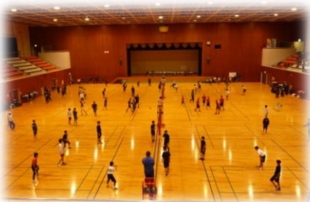
中四国強化大会 (バレーボール)