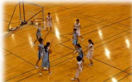
福島杯 (西部中学校)