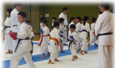
アドバイザー招聘事業 (高知県空手道連盟)