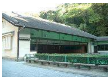
弓道場 面積 498㎡ 射場 127㎡ 近的的場 (10人立) 61㎡ 遠的的場 (3人立) 7㎡