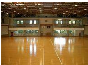
3F 試合場 フロア面積 991㎡ (33.1×29.94m) 4F 観客席 496 席