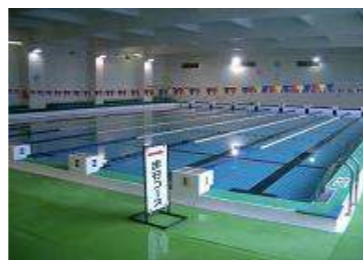
室内プール (財)日本水泳連盟公認プール 25.0m×18.7m (8コース) 水深 最大 1.5m 最小 1.15m 更衣室、シャワー室、コインロッカー