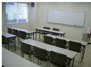
小会議室 面積 35㎡ (20人) ・会議など