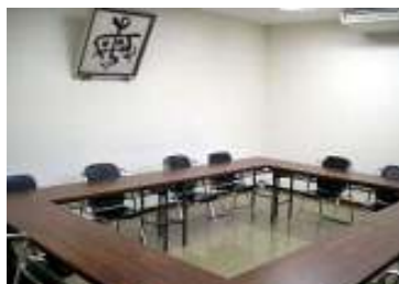
1F 会議室 面積 27㎡ ・20人程度の会議、大会控室など