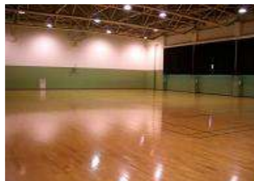
補助競技場 フロア面積 786.48㎡ (23.2×33.9m) 控室 ・スポーツ教室、レクリエーション行事など