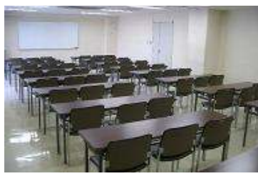
大会議室 面積 75㎡ (50人) ・会議、研修会など