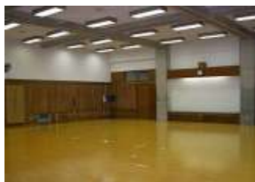
1F 剣道場 面積 202㎡ ・定期練習、大会練習会場など