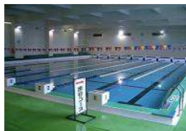
室内プール (財)日本水泳連盟公認プール 25.0m×18.7m (8コース) 水深 最大 1.5m 最小 1.15m 更衣室、シャワー室、コインロッカー