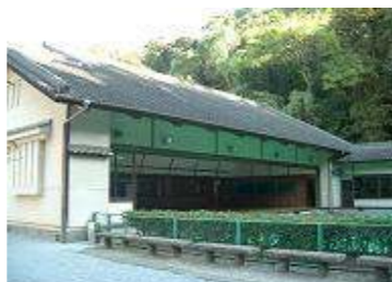
弓道場 面積 498㎡ 射場 127㎡ 近的的場 (10人立) 61㎡ 遠的的場 (3人立) 7㎡