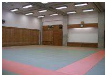
1F 柔道場 面積 187㎡ (98畳) ・定期練習、大会練習会場など