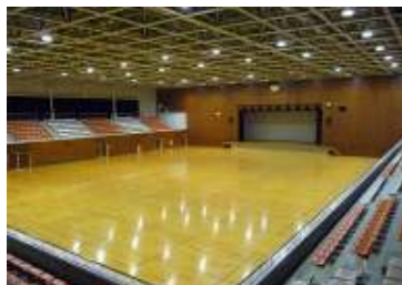
主競技場 フロア面積 1,945.30㎡ (39.7×49.0m) 1階 3,072 脚 (移動) 2階 1,572 席 (固定) 控室、湯沸室、更衣室、シャワー室 ・スポーツ大会、式典、展示会、各種催物など