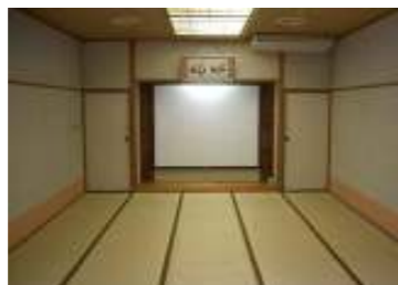
1F 研修室 面積 38㎡ (20畳) ・30人程度の会議、大会控室など